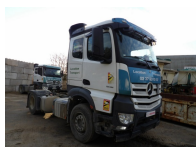
8164 - MERCEDES-BENZ ACTROS 1848