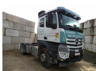
8163 - MERCEDES-BENZ ACTROS 1848