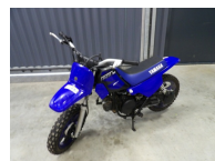
Mini moto Yamaha (PW 50 ?) non testée, vendue en l'état, pas d'envoi, à retirer à la salle (Cherré) ou prévoir transporteur.