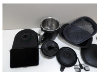
Vorwerk Thermomix TM7 et ses accessoires, occasion, non testé vendu en l'état