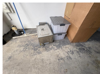
Lot de 2 bain marie en inox dont un neuf METRO