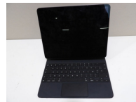
Apple IPAD, occasion non testé vendu en l'état.