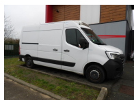
8264 - RENAULT MASTER FRIGO F3500 DCI 135CV GRAND CONFORT L2H2