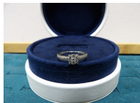
Bague en or 750/1000 et pierres blanches (abîmées) poids brut 1.91g. (on y joint une boîte et écrin de marque Fred)