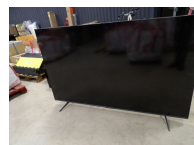
1 grand écran de télévision TCL modèle 85C69B, non testé, traces irisées sur l'écran, vendu en l'état, pas d'envoi, à retirer à la salle (Cherré) ou prévoir transporteur.