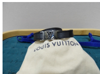
Louis Vuitton : bracelet double en cuir et métal argenté, modèle Sign It, état d'usage, déformations, rayures et un pochon de la marque ...