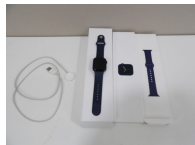
Montre connectée Apple Watch série 6, blue aluminium, 44 mm, occasion non testée avec chargeur et boîte.