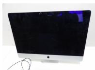
Apple ordinateur Mac (écran fissuré, non testé vendu en l'état) et un clavier et une souris.