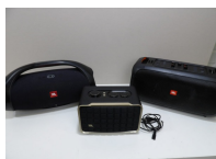
3 enceintes JBL de différents modèles (BOOMBOX 2, PARTYBOX ON-THE-GO, AUTHENTICS 200), accidents, un seul câble, non testées vendues en l'état.