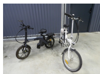
2 x 2 roues électriques pliables : 1 draisienne de marques Yeep Me et vélo Easy Bike, en état d'usage, non testés, vendus en l'état, pas d'envoi, à retirer à la salle (Cherré) ou prévoir transporteur.