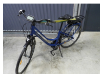
Vélo à assistance électrique de marque Nakamura attention vendu sans batterie, non testé, vendu en l'état, pas d'envoi, à retirer à la salle (Cherré) ou prévoir transporteur.