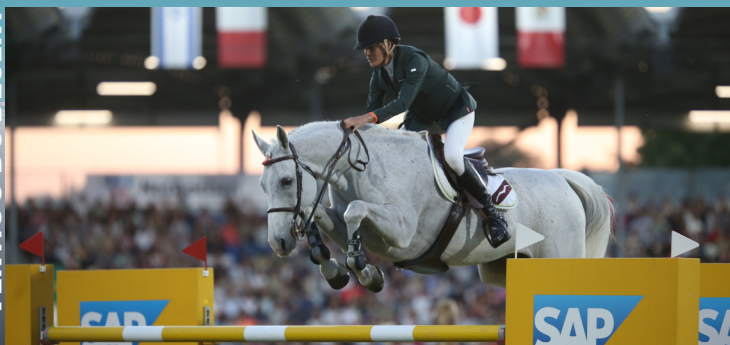
VERTIGO DU DESERT