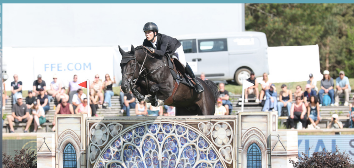
IMPRESS-K VAN'T KATTENHEYE Z