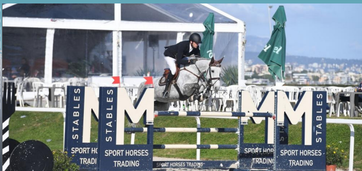
BIKINI DE HUS