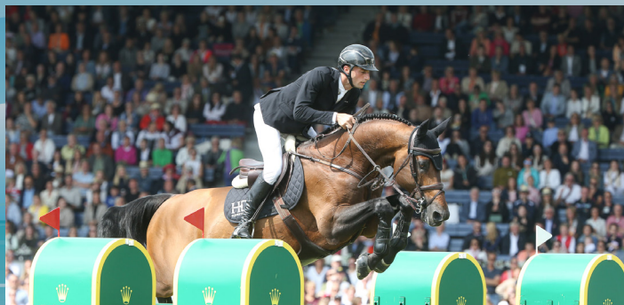
UNITED TOUCH S