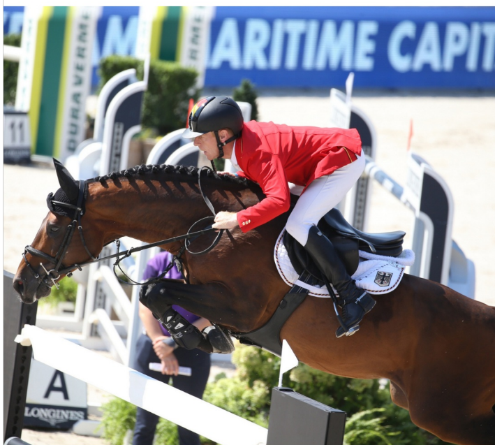
Comme Il Faut