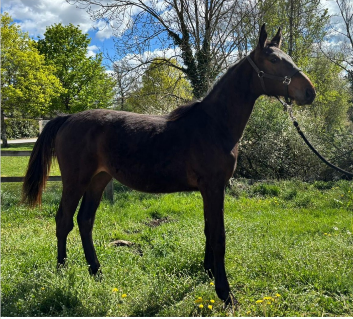
CORONA TSC Z