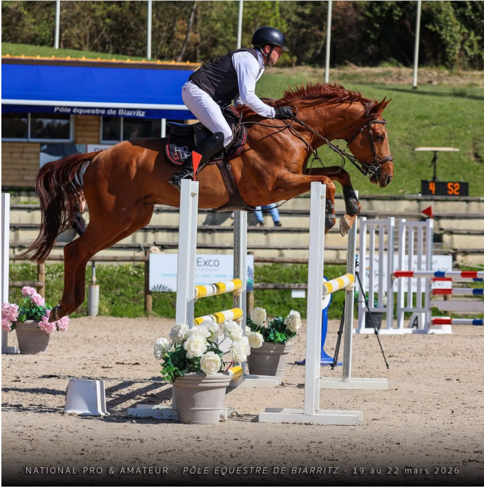
NATIONAL PRO &amp; AMATEUR - PÔLE ÉQUESTRE DE BIARRITZ - 19 au 22 mars 2026